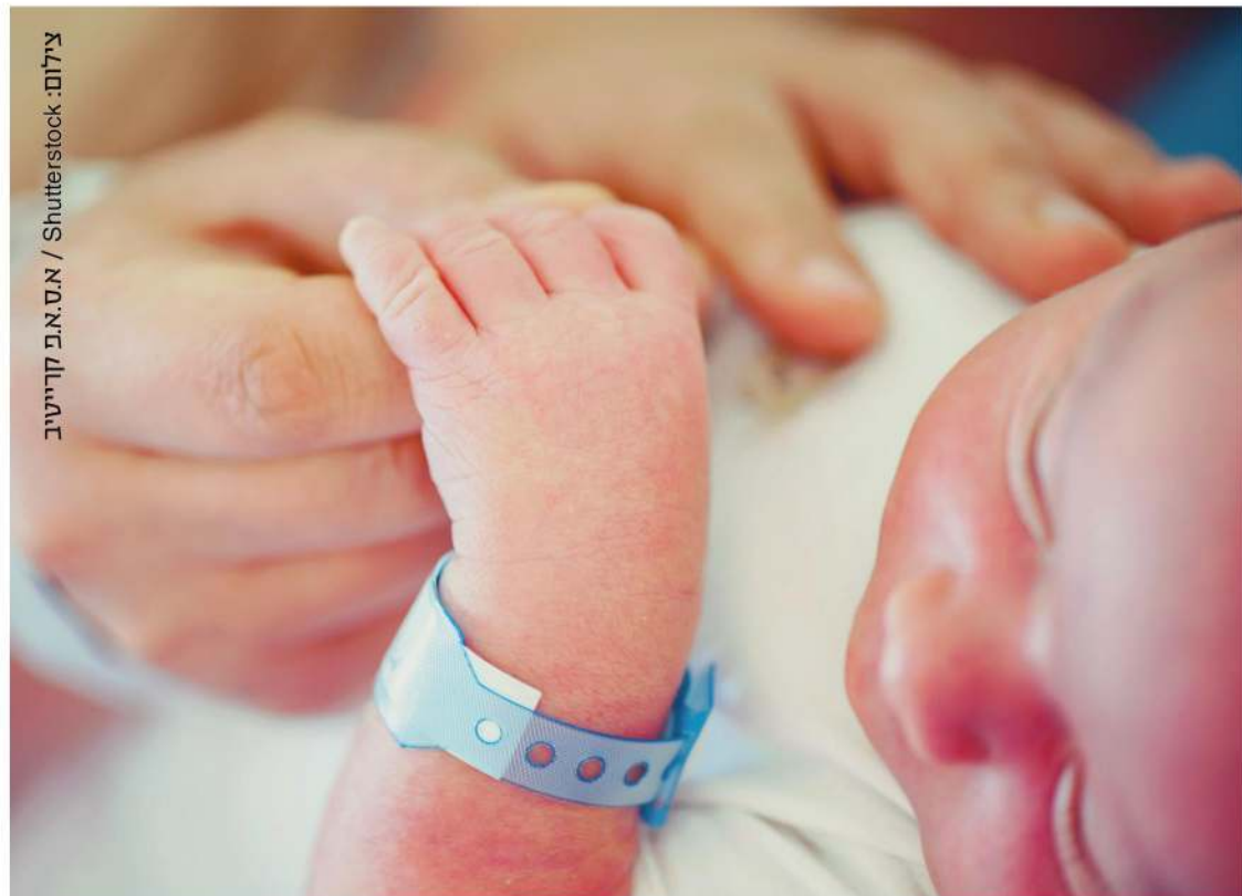
"משפחות מגיבות במהירות יחסית לשינויים במבנה התמריצים הכלכליים"

קשה להעריך מה תהיה התוצאה של ירידה בפריון על הצמיחה הכלכלית. על פי הערכות ה-OECD, ללא שינוי של ממש בדמוגרפיה, הצמיחה לטווח ארוך של המשק תיפגע בטווח הארוך. אם מביאים בחשבון את הכניסה של טכנולוגיות של בינה מלאכותית באופן מסיבי בעשור הקרוב, שיעור האבטלה אמור לעלות באופן משמעותי. עם זאת, יש לאוכלוסייה צעירה יתרון כאשר בכל הקשור לצמיחה הכלכלית. ■